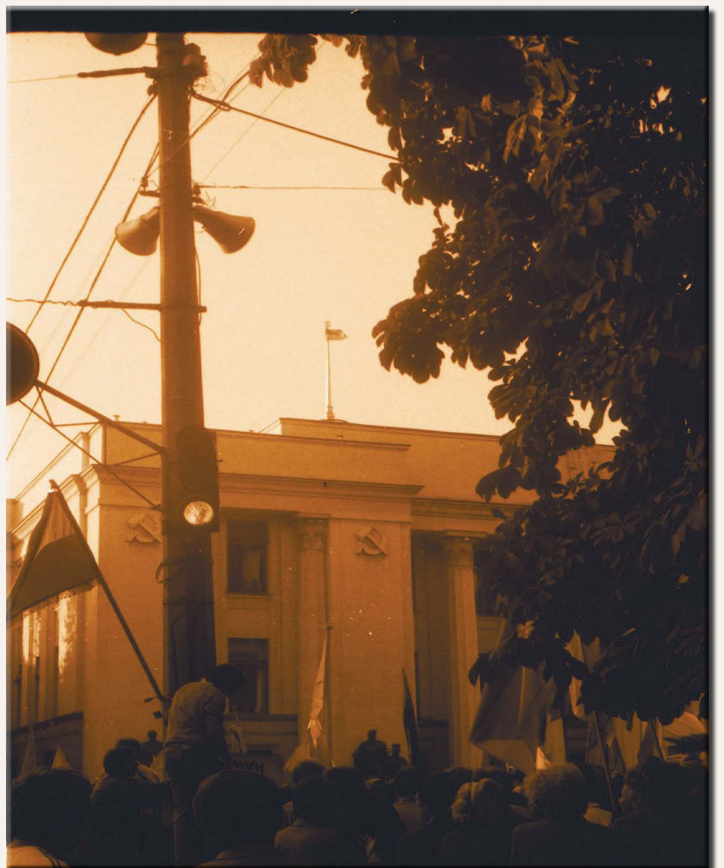
Мітинг під час підняття національного прапора над будинком Верховної Ради України, 4 вересня 1991 р. Од. обл. 0-184248